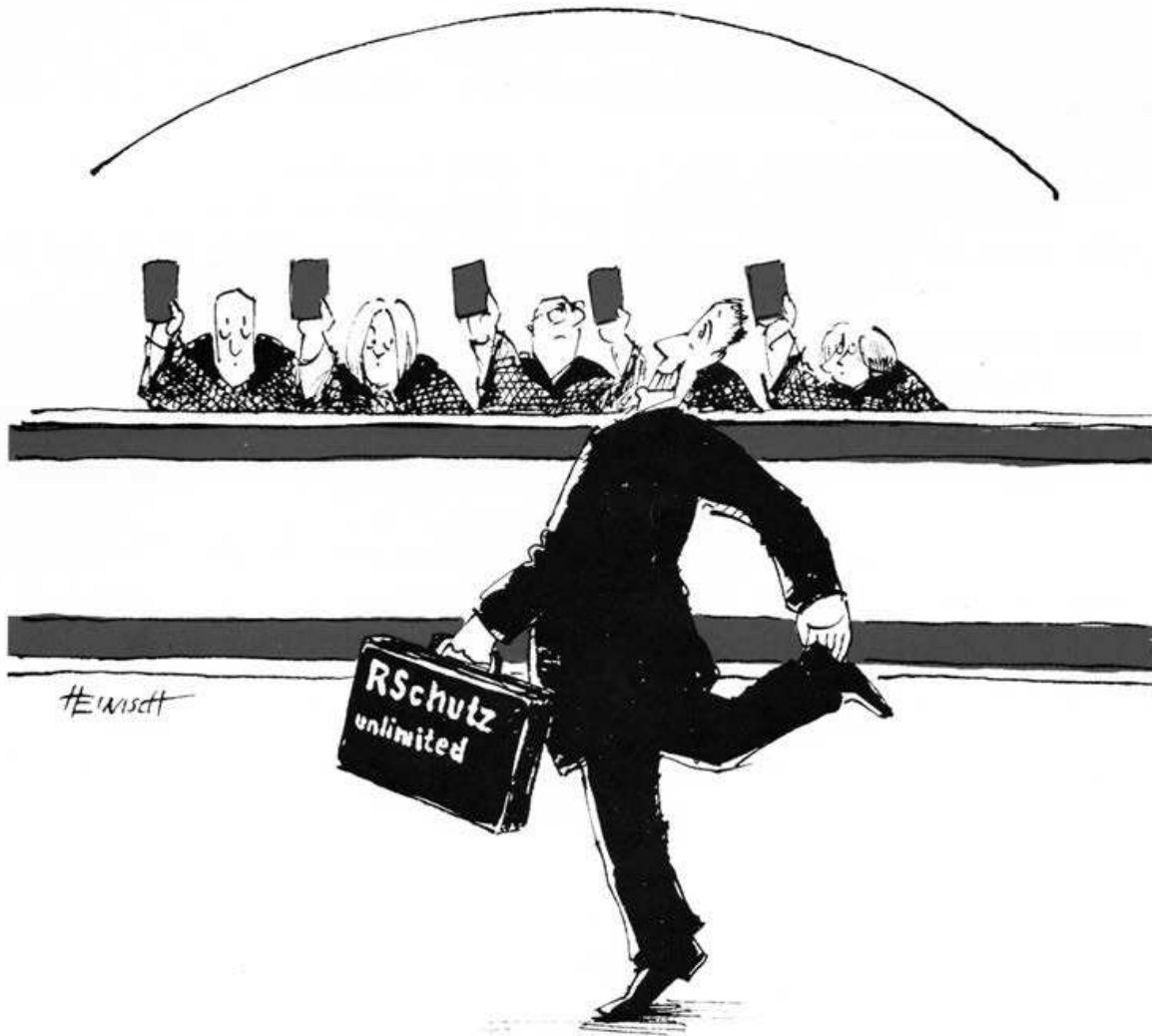
Abbildung: Rechtsschutzversicherungsversprechen im Lichte der Rechtsprechung

Zumindest auf den Webseiten der deutschen Rechtsschutzversicherer ist die Welt im Jahr 2018 noch in Ordnung. Beispielhaft sei hier die ARAG SE erwähnt, die sich auf ihrer Startseite problembewusst gibt: „Ärger mit einem Hornochsen? Wir helfen. Auch rückwirkend! Wenn Sie sich im Straßenverkehr mit einem Hornochsen streiten oder Ärger wegen Ordnungswidrigkeiten haben: Wir sind sofort und ohne Wartezeit für Sie da!“ 1 Was das Deckungsversprechen im Belastungsfall tatsächlich wert sein kann, führt der Abgas-Diesel-Skandal in bemerkenswerter Weise vor Augen. „Die Rechtsschutzversicherungen zeigten sich im VW-Abgasskandal bislang wenig kooperativ. Oft lehnen sie