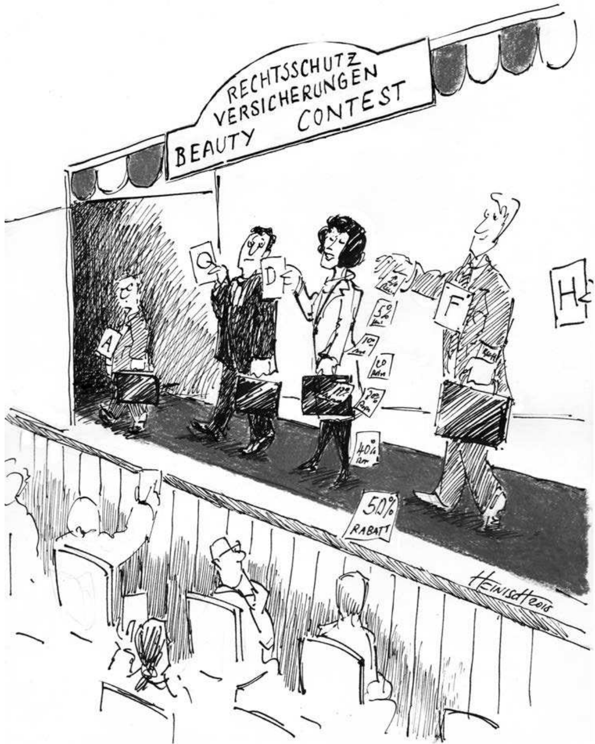
Abbildung: Beauty Contest Rechtsschutzversicherungen