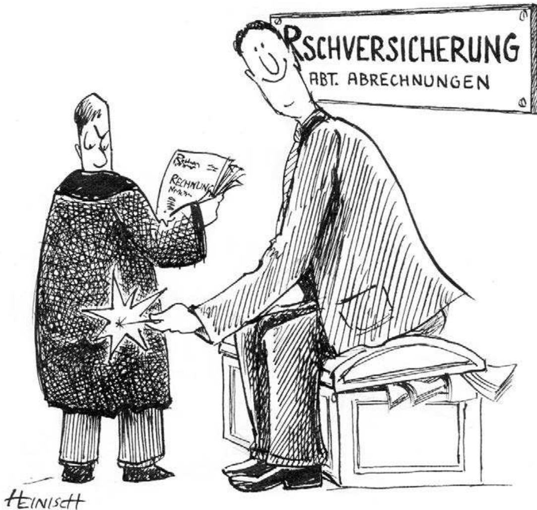
Abbildung: Meinungsverschiedenheiten unter den Beteiligten